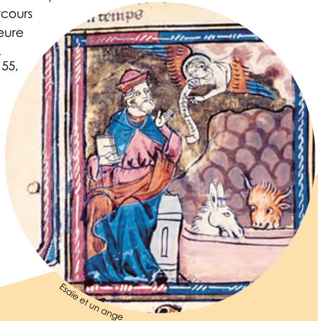
Esaié et un ange