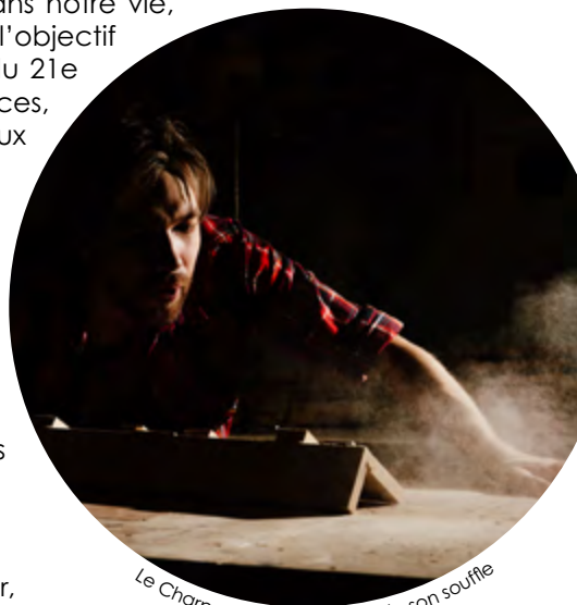
Le Charpentier dépoussière de son souffle