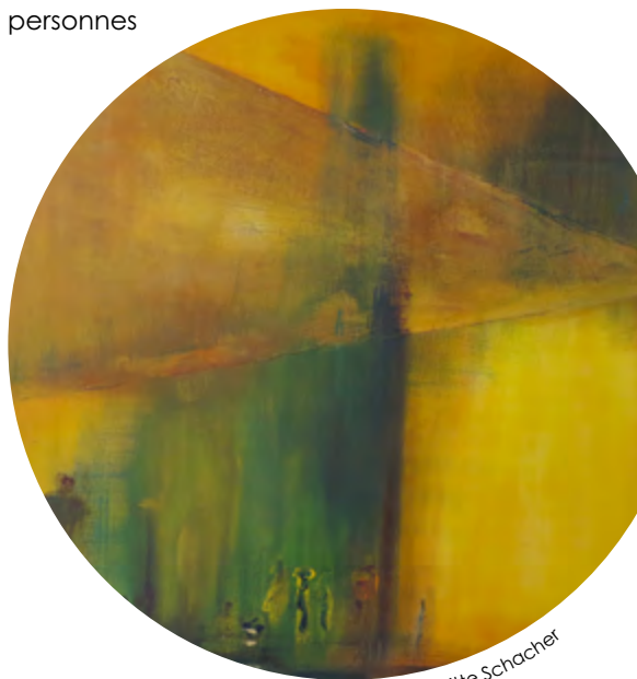
«Invitation», toile de Brigitte Schacher